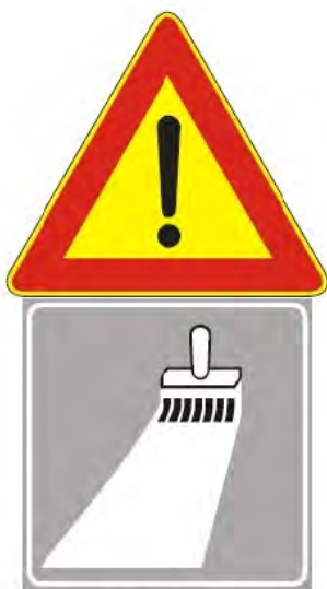
Figura II 391 Art. 31