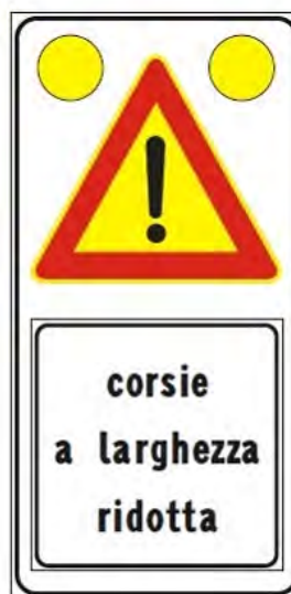
Figura II 391c Art. 31